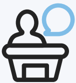
강의장에서 오프라인 교육 참석