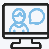
자택에서 실시간 교육수강